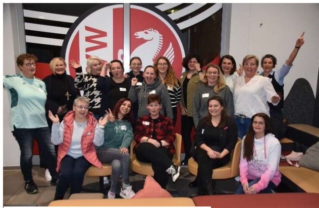
Gruppenbild TN 5. Leadership-Programm

Der Fußball- und Leichtathletik-Verband Westfalen e.V. lädt Sie ein, sich für das 6. FLVW Leadership-Programm für Frauen im Sport zu bewerben. Die Module werden alle im SportCentrum Kaiserau durchgeführt.